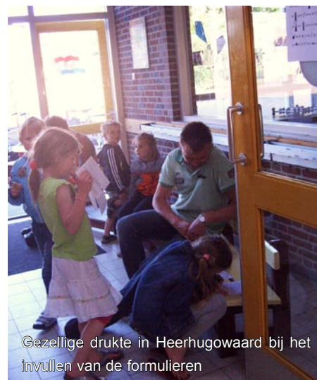
Gezellige drukte in Heerhugowaard bij het invullen van de formulieren

De sponsoring van dit jaar stond in het teken van de gelijkheid van jongens en meisjes, een project van Yojana samen met haar partners in India. Hoewel de opbrengst - wellicht met de economische crisis als oorzaak - lager was dan in voorgaande jaren, is er toch € 1.750,- bijeengefietsd.