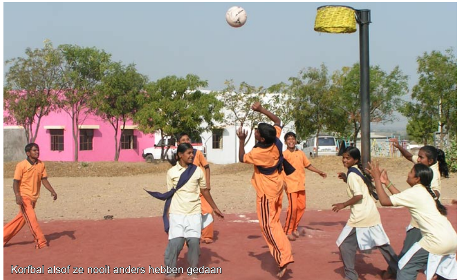
Korfbal alsof ze nooit anders hebben gedaan