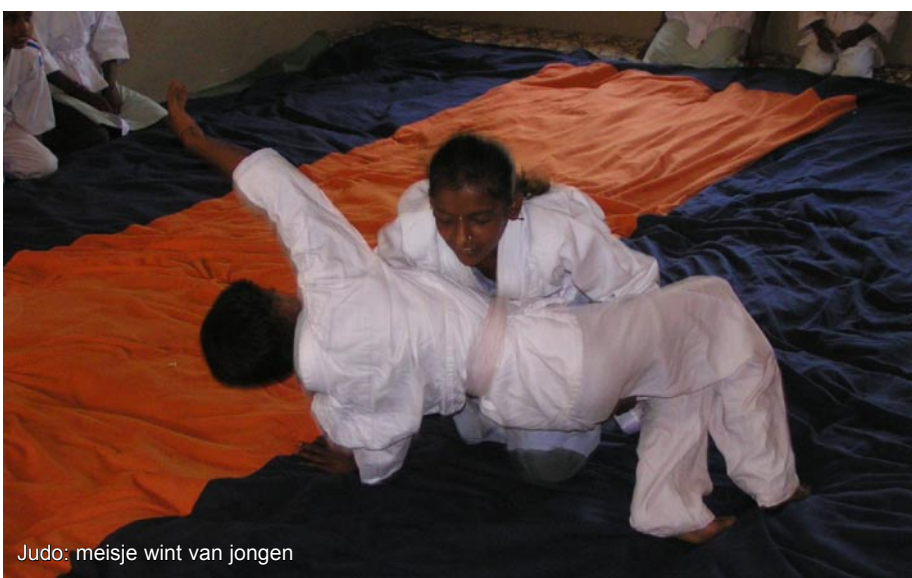
Judo: meisje wint van jongen