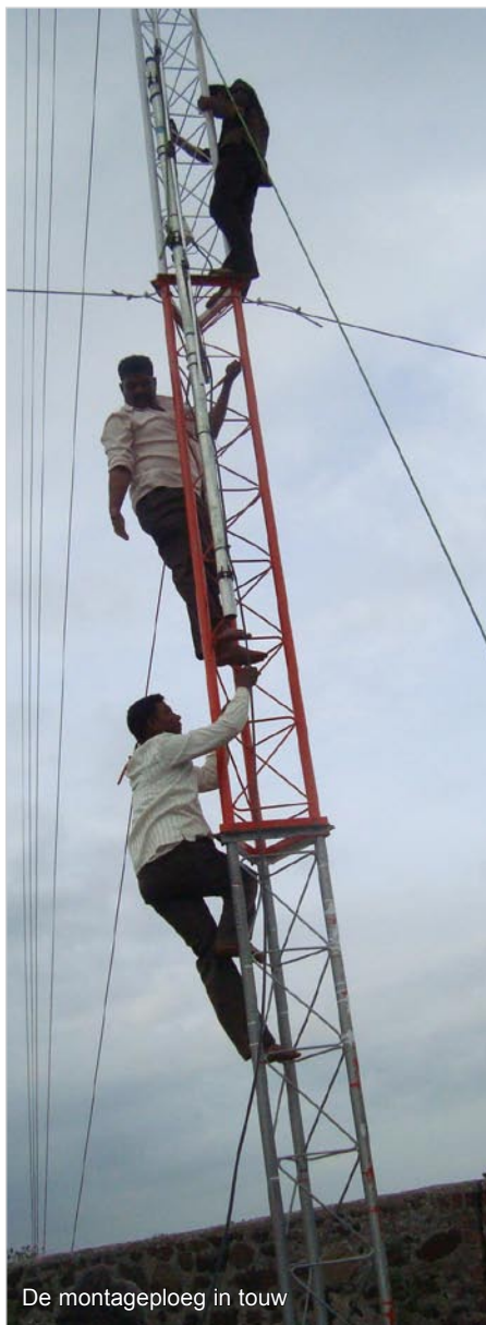
De montageploeg in touw