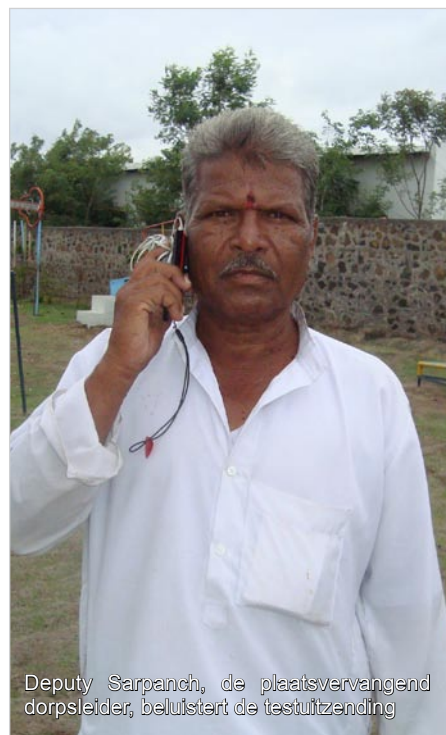
Deputy Sarpanch, de plaatsvervangend dorpsleider, beluistert de testuitzending

Vorige week heeft de installateur de zender in de mast. Het touw brak. Er waren gelukkig geen gewonden, maar er was wel schade. Intussen is de zender op de juiste hoogte aangebracht. Het werkt!